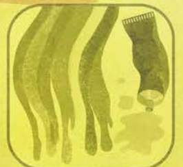
Vernici Inchiostri Adesivi