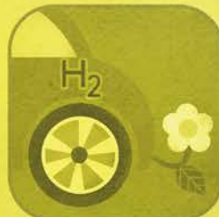
Auto a Idrogeno