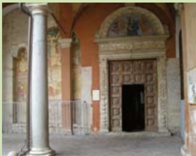
Facoltà di Agraria - Perugia

Facoltà di Medicina Veterinaria - Via S. Costanzo, 4 - 06121 Perugia