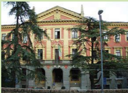
Facoltà di Medicina Veterinaria - Perugia