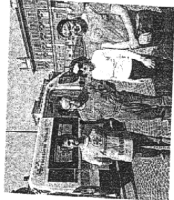
Il servizio L'ambulanza dell'Enpa