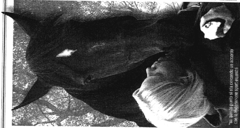
«Su questo puledro si sta cercando un accordo con la Federazione sport equestri»

Vareme Il formidabile trotatore che si è ritirato dall'attività agonistica nel 2002 e che ora è impiegato come riproduttore, il suo primogenito è stato venduto all'asta alla cifra record di 150 mila euro, dieci volte superiore a quella di un normale puledro