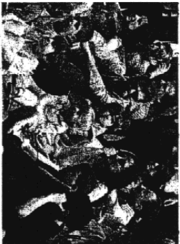
SPIRITACOLI bimbi e genitori per la festa ai giardini

E' stata un'ordinanza del marzo del 2009 a dare l'via al progetto, confermato da un decreto ministeriale dello scorso 26 novembre. Molti i punti occorrali: stop alla black list delle razze pericolose, corsi di apprendimento obbligatori per i cani che hanno dimostrato disturbi comportamentali, istituzione di un registro dei cani «monitorati» a cura dell'Asl (con misure di prevenzione ed eventuali interventi terapeutici) e assicurazione obbligatoria di responsabilità civile per i cani iscritti nel suddetto registro.