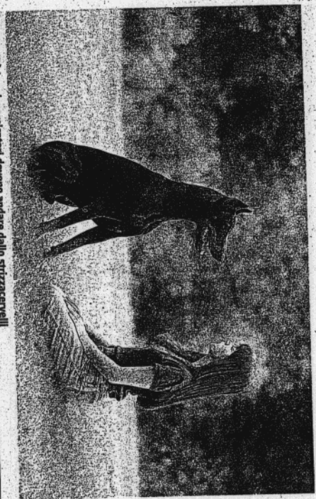
LA NOVITA' I cani moriscatori devono andare dallo strizzacervelli

rinario ufficiale repta che la bestiola sia a «rischio potenziale elevato», ordina una valutazione comportamentale presso un Medico Veterinario esperto in comportamento animale. I dipartimenti di prevenzione veterinari dovranno poi tenere un registro aggiornato dei cani identificati «a rischio potenziale elevato» e mediantе ordinanza disporranno «l'obbligo di stipula da parte del proprietario del cane, del corso di base con lo psicologo, dell'uso congiunto di museruola e guinzaglio al fuori dell'ambiente domestico e di stipula di un'assicurazione di responsabilità civile per danni contro terzi». Sempre che l'analisi canino non convinca il cane a diventare più uomo.