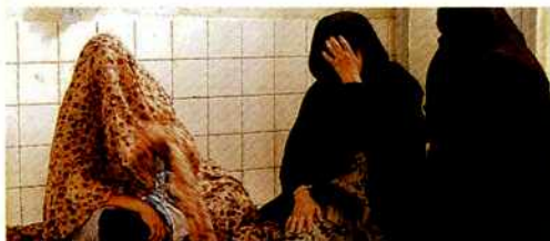
Una donna rimasta ferita nella sparatoria