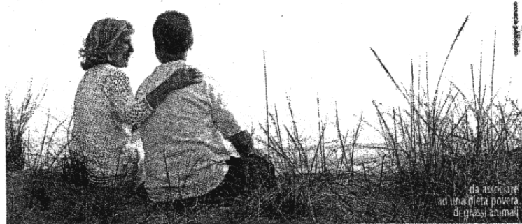
da associare ad una dieta povera di grassi animali