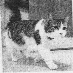
Il gatto becchino

A PHUKET, GLI ELEFANTI SENTIRONO IL MAREMOTO CON VENTI MINUTI D'ANTICIPO. FUGGIRONO SU UNA COLLINA E COMINCIARONO A BARRIRE