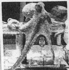
Il polpo star

IL POLPO PAUL È DIVENTATO FAMOSO PER I PRONOSTICI DURANTE I MONDIALI DI CALCIO CON UN GROSSO AIUTO DALLA FORTUNA