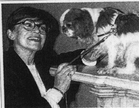
Franca Valeri con Aroldo «Roro» IV

«È un fatto di vita comune. Il cane è un compagno, certo anomalo rispetto a un essere umano, ma col quale si stabilisce un rapporto di comunanza affettiva difficile da spiegare a chi non l'ha provato. Lui ti guarda, ti capisce, ti