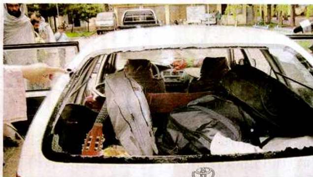
L'auto crivellata di colpi sulla quale viaggiava la bambina afghana

Una bambina afghana di 13 anni è morta uccisa dai colpi sparati da un blindato italiano di pattuglia nella zona occidentale dell'Afghanistan. Secondo l'Esercito, la macchina non si è fermata all'alt dei militari; secondo lo zio della piccola vittima, al volante dell'auto, ieri mattina pioveva molto in quella zona e se non si è fermato è perché ha «visto le luci quando era troppo tardi». I due con alcuni parenti stavano andando ad Herat per assistere a un matrimonio. Lo Stato Maggiore della Difesa puntualizza che «le regole d'ingaggio sono state rispettate». Ma la vedova Calipari mette in guardia: «Niente insabbiamenti come per mio marito».